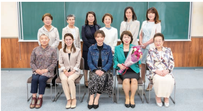
▲ 部長就任時、役員の皆さんと記念写真

時間に余裕があるときは、女性部会のみなさんや友人たちと酌み交わすのが楽しみです。山登りは特別感がありますが、お酒は日常的にリフレッシュさせてくれます。あと、日帰り温泉もよく行きますよ。お誘いお待ちしております！