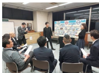
▲ 社会貢献グループを中心に1年かけて準備しました