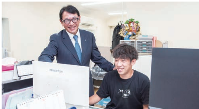
▲ 従業員とのコミュニケーションを大切にする柴さん

晩酌が好きで、ワイン・ビール・焼酎・ウイスキーと何でも飲むのですが、週に一日だけは必ず抜いています。当時小学生だった息子から「一日だけ抜いてください」と書かれた紙を渡されて署名したんです（笑）。その紙は今も家に飾ってあり、約束を守り続けています。