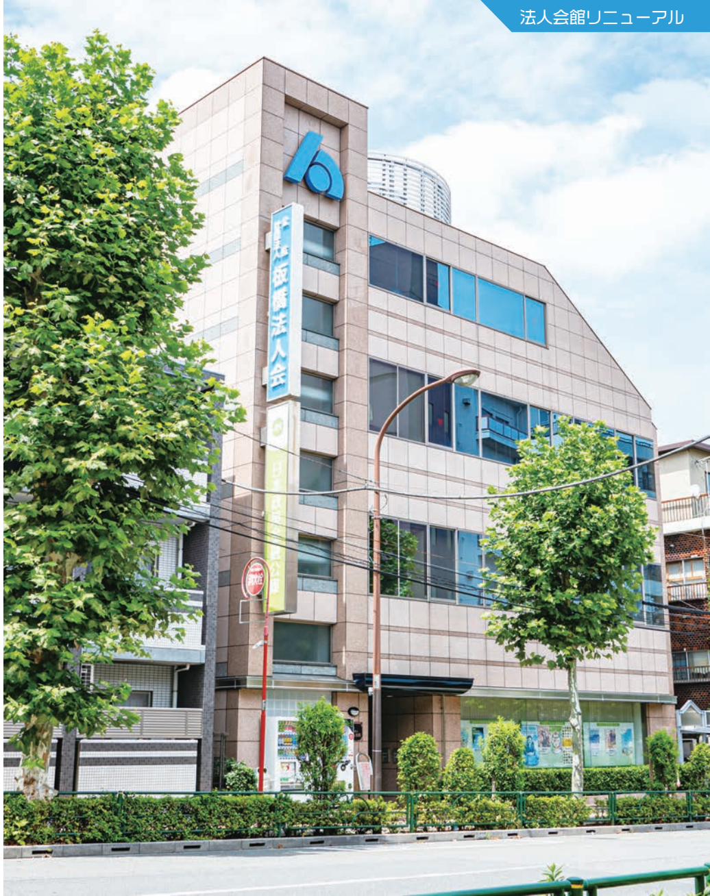
法人会館リニューアル