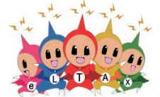
eLTAX イメージキャラクター エルレンジャー